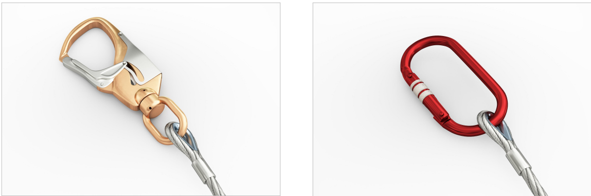
Abbildung 3 – Verbindungselemente mit automatischer Verriegelung, Beispiel: Karabiner