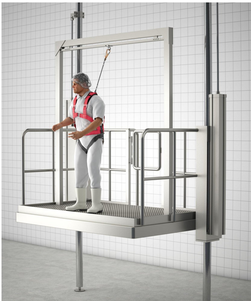
Abbildung 6 – PSA gegen Absturz für Hubarbeitsbühne - Beispiel