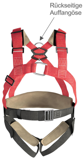
Abbildung 1 – Auffanggurt nach DIN EN 361