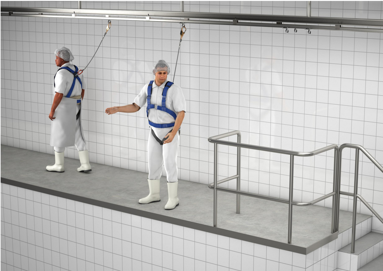
Abbildung 5 – PSA gegen Absturz für feststehende Laufstege bzw. Arbeitspodeste - Beispiel mit absturzsicherem An- und Abschlagbereich