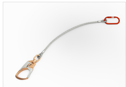
Abbildung 2 – Verbindungsmittel, Beispiel: Stahlseil